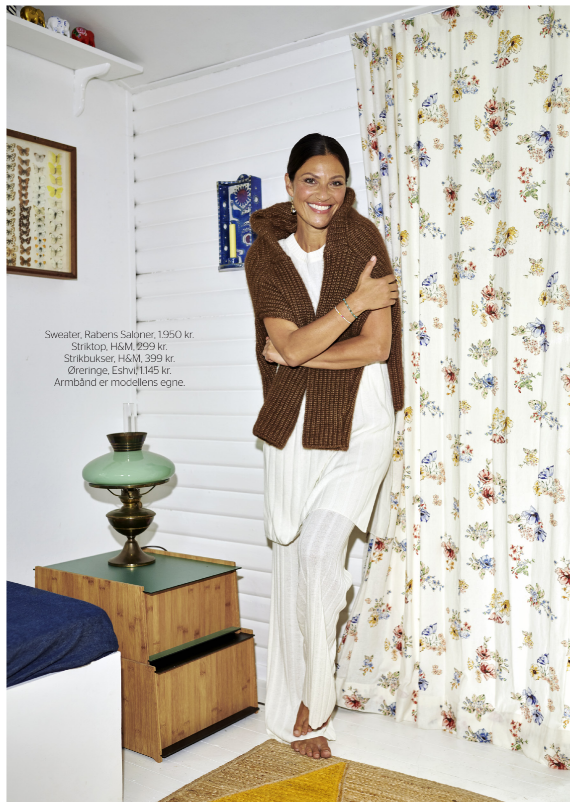
Sweater, Rabens Saloner, 1.950 kr. Striktop, H&M, 299 kr. Strikbukser, H&M, 399 kr. Øringer, Eshvi, 1.145 kr. Armbånd er modellens egne.