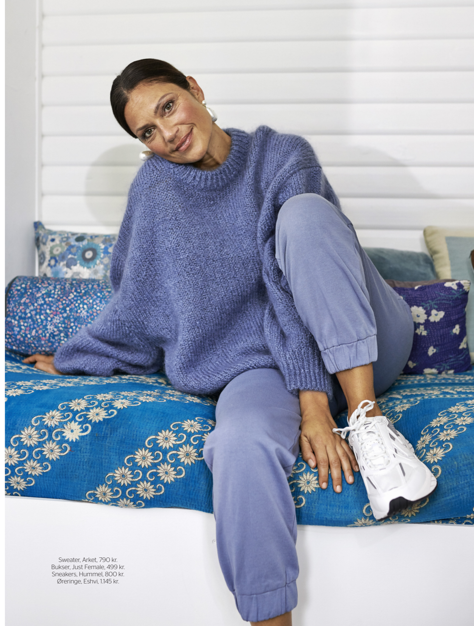
Sweater, Arket, 790 kr. Bukser, Just Female, 499 kr. Sneakers, Hummel, 800 kr. Øringer, Eshvi, 1.145 kr.